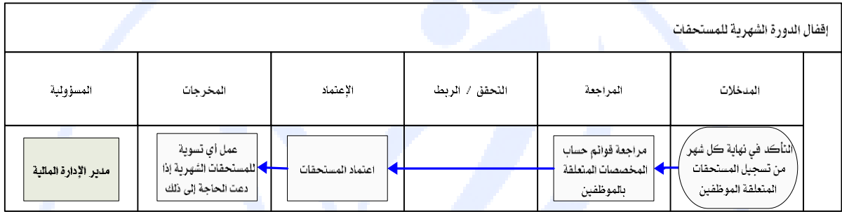
شكل رقم / ٥

يوضح المخطط البياني التالي ( شكل رقم/٥) طريقة تسلسل العمل لإقفال الدورة الشهرية للمستحقات: